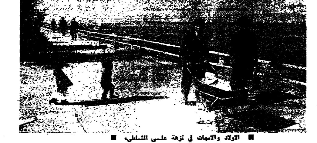
الاولاد والامهات في نزوة على الشاطئ